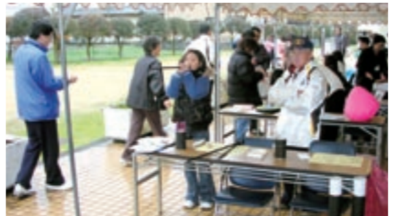
昨年の「菊池市生涯学習フェスティバル」で「公式吹き矢」を紹介している様子です

このたび、「広報きくち」を利用して頂き、体育指導委員の活動現況などを市民の皆様へお伝えすることができることになりました。心から感謝申し上げます。 さて、近年我々を取り巻くスポーツ環境も、社会情勢と共に著しく変化して参りました。競技スポーツを中心に、トップアスリートを目指した指導育成も大切で、その見直しもされ効果も上がってきています。 しかし、体育指導委員の設置に伴い、競技スポーツと共に生涯スポーツの推進が重要視されるようになってきました。そのため私達体育指導委員は、地域住民のニーズに応えるため、楽しさを前面に出したニュースポーツ（レクリエーションスポーツ）などを重視した指導育成活動に全力を注いでいるところでございます。 今後、このような広報活動によって地域住民とのコミュニケーションが図られるようになれば、住民のスポーツ的自立支援にも役立ち、ひいては生涯スポーツの推進にも大きな役割を果たすのではないかと期待を寄せております。 最後に、今回の広報掲載へ向けて大変ご尽力頂きました各関係者の皆様方へ厚くお礼申し上げます。ご挨拶といたします。