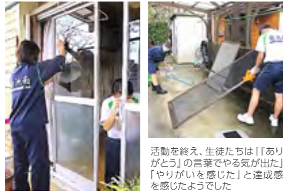
活動を終え、生徒たちは「『ありがとう』の言葉でやる気が出た」「やりがいを感じた」と達成感を感じたようでした

3年生の総合的な学習の時間に地域の高齢者のお宅を訪問し、草取りや窓拭きなどの清掃活動を行いました。高齢者の皆さんも喜ばれ、生徒も思い出深い交流ができました。活動を通して生徒たちが地域に誇りを持ち、積極的に未来の社会づくりやまちづくりに貢献する意識が育つことを期待しています。