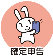
確定申告 (2024年度より)