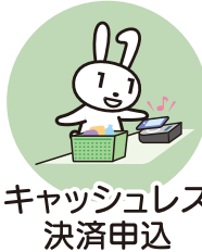
キャッシュレス 決済申込