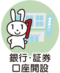
銀行・証券 口座開設