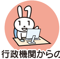
行政機関からの お知らせ・各種証明書