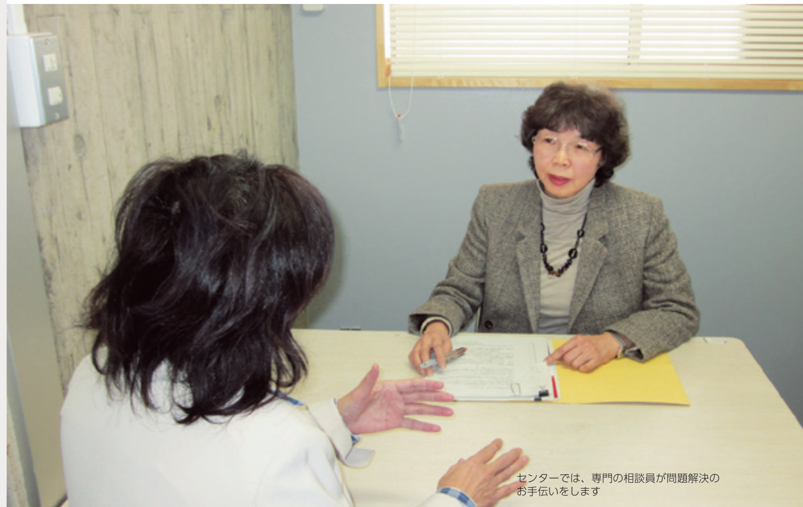
センターでは、専門の相談員が問題解決のお手伝いをします

問い合わせ先 専用ダイヤル ☎0968(36)9450 全国共通消費者ホットライン ☎0570(383)0999