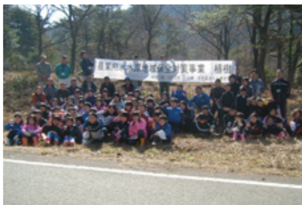
福村市長も参加した植樹祭

植樹祭は、旭志麓地内の市有林で行われました。迫水小学校の3、4年生と七城小学校の4年生64人も参加し、約200本のヤマサクラやヤマツツジを植林しました。これは農業用水水源地域保全対策事業として行われたものです。地球温暖化が問題となっている中、森林を育てることが重要な課題とされています。そこで大切な森林を守るために、菊池市土地改良区が主体となって行ったものです。