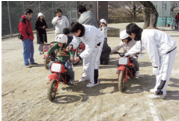
歩くだけでなくゲームも頑張りました

運営にあたり、菊池市青少年育成推進委員会、菊池市体験活動ボランティアの皆さんにスタッフとしてご協力いただきました。また菊池高校と菊池女子高校からも多くの生徒さんにボランティアとして参加していただきました。