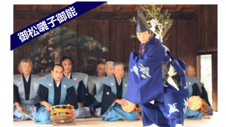
中世、米作りの発展に寄与した菊池氏が懐良親王を迎え、年頭の祝儀として行ったことを起源とする。五穀豊穡を祈る芸能