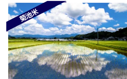
ミネラル豊富な水と肥沃な土壌が育む菊池米は、世界最大規模のコンクールでも高い評価を受けている