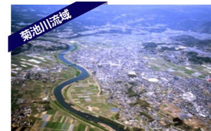
菊池川流域は、古代から現代までの日本の米作り文化の縮図であり、文化的景観や芸能・食文化に出会える場所となっている

TEL / 0968-25-7250 メール: kikaku@city.kikuchi.lg.jp