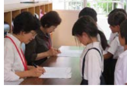
学校応援団の1つ「赤ペン先生」がプリントを丸付け