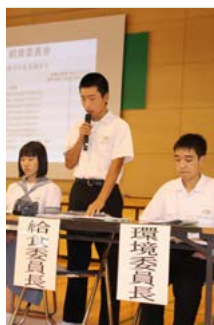
質問や意見が飛び交い、自主自治を実感しました

全校生徒が参加する生徒総会を開催し、今年度の活動計画を決めました。生徒会が今年度の学校のテーマとして「築く」を提案。「自分の役割に気づく」、「活気あふれる南中を築く」といった思いが込められた言葉です。世界中の学校と交流できる「ユネスコスクール」の加盟も提案し、議決されました。