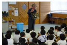
隈部さんの話に関心する児童たち