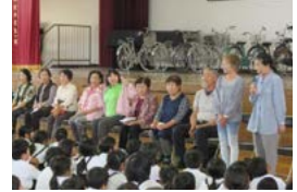
自己紹介と活動を報告する学校応援団

学校応援団として学校の取り組みに参加する地域住民と児童が顔合わせをする「よろしくお願ひしますの会」を開催しました。泗水小はコミュニティ・スクールを導入しており、児童や保護者が主体的に参加できる取り組みを進めています。参加者は「地域をもっと好きになってほしい」と児童に話しました。