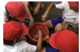
塩加減を調節して「塩水選」の体験

5年生が塩水で米の種子を選定する「塩水選」を行いました。種もみを一定濃度の塩水に入れ、浮いたものを取り除き、沈んだものを種子として選択。苦労を重ねた後に種子が浮くと、児童から歓声が上がりました。今後は稲作から収穫までの体験を通し、地域の良さを学ぶ予定です。