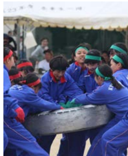
タイヤの奪い合い。体育大会は大いに盛り上がりました

体育大会を開催しました。生徒会長や団長をはじめ、各学年のリーダーを中心に1カ月前から準備を開始。全校生徒119人が心をつなげて成功に導きました。当日は朝早くからPTA会長や保護者も協力。準備や片付けを含め、スムーズに体育大会を進行できました。