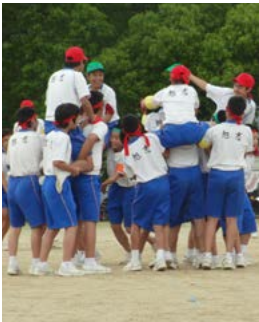
白熱した戦いが繰り広げられた騎馬戦