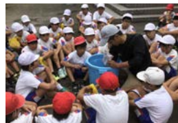
地域栽培指導員の話をもとに真剣に聞きました