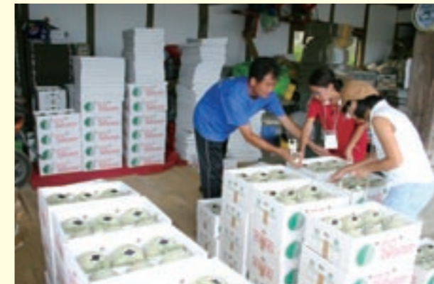
メロンの箱詰めを体験する参加者たち

ファームスカウト学校は、農家民泊などの集団生活の中で、農畜産業・自然学習などの体験により、七城町の農業および自然と親しみ心豊かな児童の育成を図ることを目的に、毎年行われています。