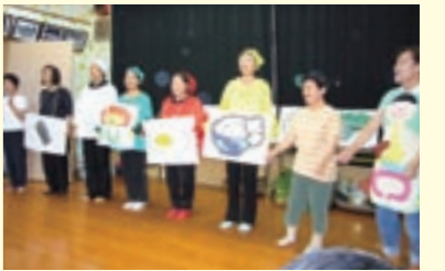
子どものおやつや伝承料理の講習、園児・小学生対象の食育講座

や講習会などを行っています。○行政では地域の各組織と連携し、各種健診や教室でライフステージに応じた健康づくり事業を行い、望ましい食生活や食習慣の啓発、指導を実施しています。