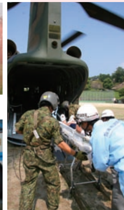
自衛隊のヘリ「チヌーク」に負傷者を搬送する隊員たち