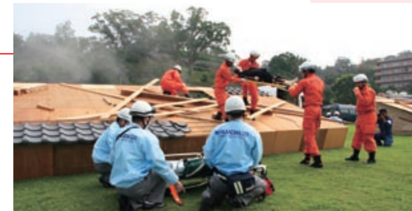
倒壊家屋に見立てた建物内から負傷者を救出する「菊池広域連合消防本部」の隊員たち