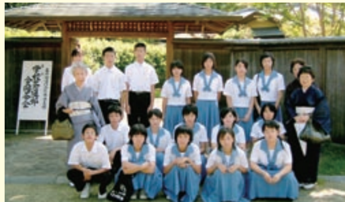
お茶会に参加した生徒たち

旭志中学校の2・3年生18人は、薄茶席と立礼席に入り、他校の生徒のたてたお茶をいただき、毎週水曜日に行っている選択家庭科(茶道)の授業の成果を出すことができました。