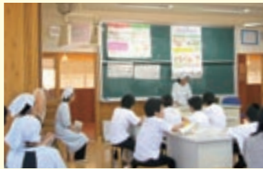
中学生、高校生の生活習慣病予防のための講義と調理実習

※「ヘルスサポーター」とは、自分の身体レベルや生活スタイルにもとづいた健康づくりを実践し、自己を確立する人のことです。平成17年度は、健康づくり推進協議会主催の「健康づくり大会」で「食」のコーナーを設け、食育の啓発と推進を行いました。