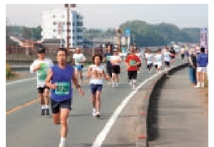
昨年の「コスモスマラソン」