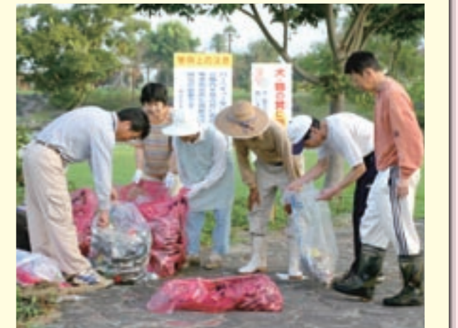
回収したごみを分別する会員たち