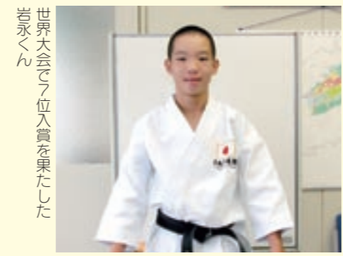
世界大会で7位入賞を果たした岩永くん