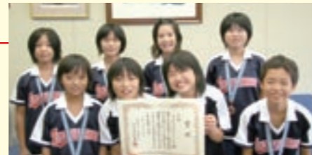
ビーチボールバレーの部で3位入賞した富の原北・東区子ども会のメンバーたち

大会は、猛暑の中での戦いとなりましたが、両チームとも熱戦を繰り広げ、その結果、みごとビーチボールバレーの部で、富の原北・東区子ども会が3位入賞を果たしました。