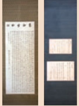
水足父子の書（西照寺蔵）

本格的な「文教菊池」の始まりは、今から二五〇年前前の宝曆・明和期に、熊府の水足博泉（平之進、一七〇七〜三二）や山鹿郡の加々見鶴灘（一七〇四〜五一）に師事した渋江紫陽（一七一九〜九二）からでした。それは、宝曆五（一七五五）年の秋山玉山の肥後藩校「時習館」の開校よりも早い時期でした。