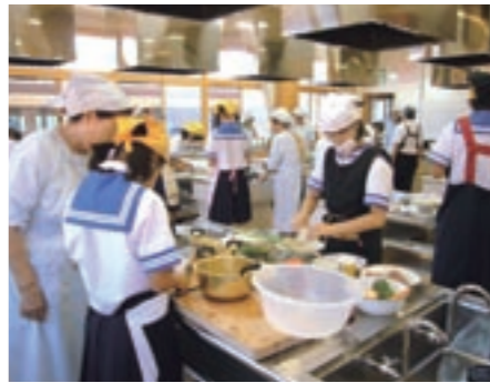
中学校での「郷土伝承料理教室」

生活スタイルの変化により、朝食を取らない就学前の児童や小・中学校の生徒がみられます。また、ファストフードや加工食品などの食の多様化により食品アレルギー疾患を持つ子どもが増えています。さらに、家族の食事時間の違いから独りで食事をする「孤食」の児童、生徒もみられます。