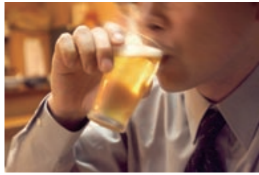
適量を守ることが、お酒を楽しむポイントです

「酒は百薬の長」といわれるように、アルコールは適度に摂取する かぎりには体にプラス効果が期待できます。 食前酒は心身の緊張をほぐし食欲を増進させ、また、社交の場では 人間関係をスムーズにし、精神的な意味で役立つこともあります。し かし、飲酒の習慣はアルコールの過剰摂取をまねきやすいもので、そ の結果、アルコール性肝障害やアルコール依存症が引き起こされ、こ れが進行すると肝硬変や神経障害になり人生を破局に導くことにもな ります。 今回は、アルコールが体におよぼす影響について考えてみます。