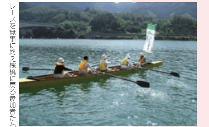
レースを無事に終え桟橋に戻る参加者たち