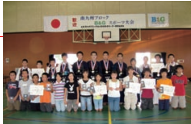
南九州ブロック B&G スポーツ大会に参加した子どもたち