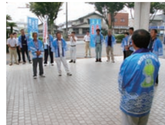
菊池市役所玄関前であった出発式