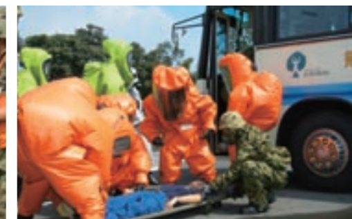
サリンとみられる化学物質がまかれたと想定したバスから負傷者を救出する隊員たち