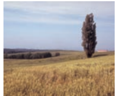
限られた大切な土地。土地の有効利用を考えてみましょう

私は、今までに講演に来られた方々のお話を聞き、すぐに「かわいそつ」という思いが出て来