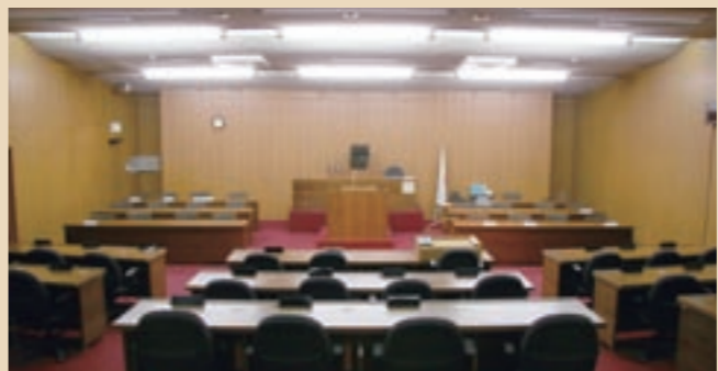
問い合わせ先 社会教育課

傍聴は自由ですので、皆さんの参加をお待ちしています。 とき 10月7日(土) 午前9時から ところ 菊池市役所3階 市議会議場および各委員会室 内容 子ども議員による意見・質問・市執行部からの答弁