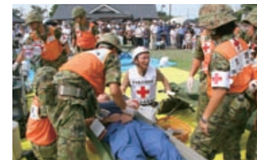
トリアージセンターへ次々と運ばれてくる負傷者に救護活動をする医療関係者たち