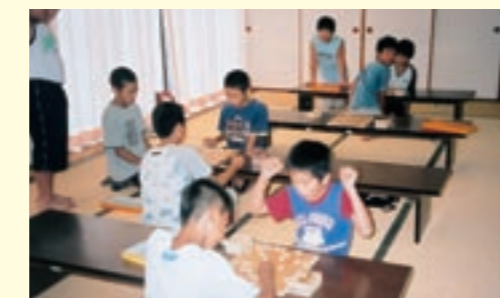
大会で練習の成果を発揮する子どもたち