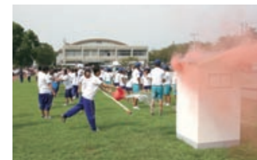
バケツリレーで消火活動をする菊池高校・菊池女子高校の生徒たち