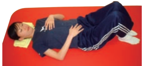
鼻から吸った時にお腹をふくらませ、口から吐く時にお腹をへこませます。これを、ゆっくり10回行います

介護保険の認定を受けている人で、介護が必要になった原因は、関節症や腰痛症、骨折が上位を占めています。 歳を取ってくると、筋力の低下やバランス能力の低下などから、歩幅は狭く、つま先は上がりにくくなり、転倒しやすくなります。転倒を予防するには足や体の筋力をつけることが大切です。