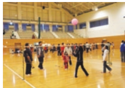
風船バレーは、小学生の女の子が優しく相手をしてくれて、幼い姉妹が喜んでくれました

スポレク祭の競技と平行して、ニュースポーツ体験コーナーを設けました。今回は、ファミリーバドミントン、風船バレー、卓球バレーなどたくさん用意しました。ファミリーバドミントンは、どのグループも長時間楽しんでもいました。卓球バレーは昨年が続いていたので、やり方を覚えている人がいました。これらのニュースポーツの中から、次のスポレク祭の種目が出るかもしれませんね。