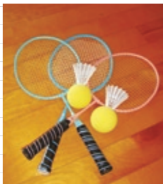
使用するラケットはバドミントンのラケットより少し短いもので、羽根の先にはスポンジ状のボールがついています

とても慣れた様子で競技を行っていました。100個の玉を44秒という速さで入れてしまいうチームもあり、他のチームからは溜息が漏れていました。また、最後の1個がなかなか入らず、あきらめムードのチームもありました。みんな真剣ながらも楽しそうに競技をしていました。