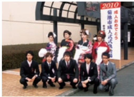
平成21年度の実行委員

日に出席できる人 募集人員 20人程度 募集期限 5月31日(月) 申込方法 電話またはメールでお申し込みください。 ※申し込みの際、住所・氏名・電話番号をご連絡ください。 問い合わせ・申込先 生涯学習課 メールアドレス shakaikyoku@city.kikuchi.lg.jp