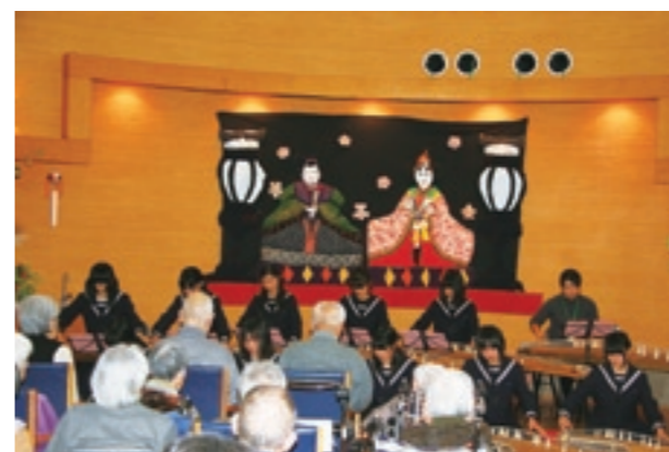
最後の授業となる演奏会で、琴を演奏する泗水中生徒たち

「さくらさくら」「うさぎ」「ひなまつり」の3曲の演奏がされると、利用者や職員の皆さんは、琴の美しい音色に合わせ、歌詞を口ずさんだり、聴き入ったりしていました。