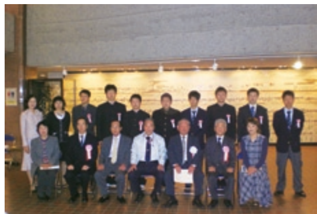
今後の活躍を期待しています

菊池地区(菊池市・合志市・菊陽町・大津町)合同で開催され、菊池地区全体では35人の入隊者があり、その中で菊池市からは10人が入隊されます。激励会終了後には、西部方面音楽隊による壮行会演奏もあり、緊張していた入隊予定者もリラックスして演奏を聞いていました。