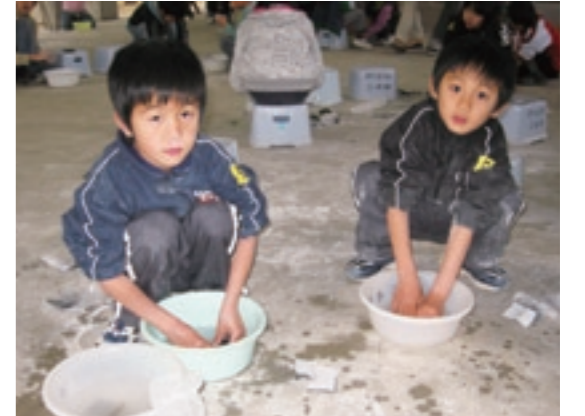
勾玉作りに没頭する子どもたち

また、勾玉づくりでは、それぞれ思い思いの形に仕上げた勾玉を誇らしげに自慢し合う子どもたちの笑顔を多く見ることができました。