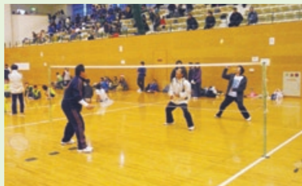
スポレク祭の体験コーナーでも、ファミリーバドミントンが開催され、たくさんの人が体験しました

競技は、10人で100個の玉をできるだけ早く籠に入れてしまいう競技ですが、選手の皆さんは