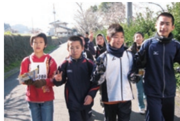
楽しそうにコースを歩く参加者

菊池市中央公民館前をスタートして、將軍木などを經由する約7kmのコースを歩きました。子どもだけのグループや保護者も一緒に参加するグループもあり、子どもたちの元気に負け、大人の方が歩き疲れる場面もありました。また、菊池高校と菊池農業高校、菊池女子高校から16人の生徒がボランティアとして参加され、大会を支えていただきました。