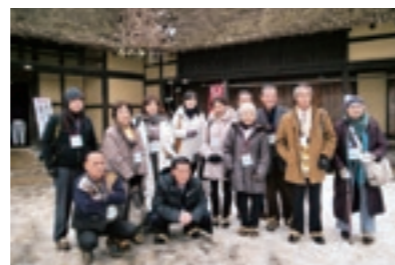
菊池市民交流団員(遠野ふるさと村にて)

遠野市の人口は旧菊池市とあまり変わらず、また山に囲まれた地形、大きな企業もない、冬は雪に覆われて野菜などの作物も育てられない、そのような土地柄でありながら、菊池市にはない遠野市民の熱い思いと共に、交流の会の人たちの「おもてなしの心」に心温まる3日間であった。どんどはれ。