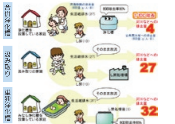
図①合併浄化槽・単独浄化槽・くみ取りの放流水の汚れ比較図

この事業は浄化槽本体を市で設置し、市が浄化槽本体の維持管理をしていく事業です。工事費の一部負担をしていただくだけ