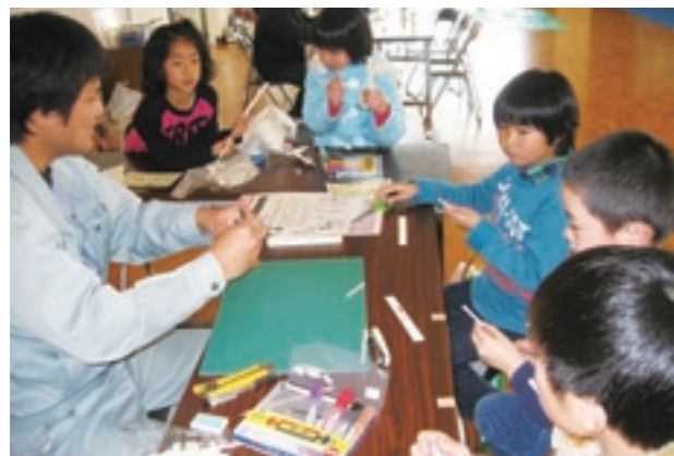
真剣にストローとんぼを作る参加者

木工体験は、慣れない金づちを手に友達やスタッフと協力し合いながら、イスや本棚、CDラックを完成させていました。