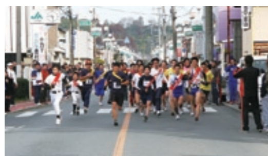
一斉にスタートする選手たち