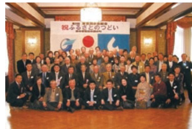
東京泗水会の会員

会場は、ふるさとでの思い出話や、最近のふるさとニュースなどで、大変盛り上がり、時間が経つことを忘れるくらい楽しい雰囲気でした。菊池市の特産品が当たるビンゴゲームでは、泗水地域に限らず菊池市のいろんな特産品が準備され、皆さんが思いの賞品を目指して、真剣に競っていました。