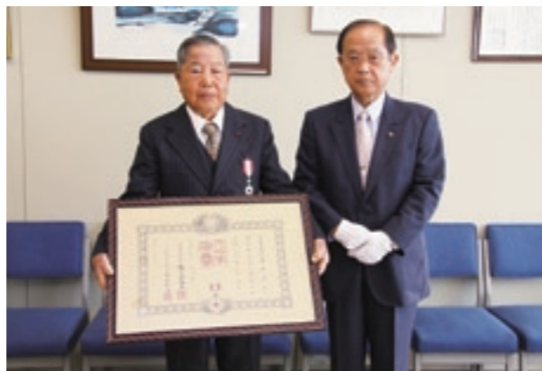
授章おめでとうございます