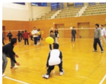
ふらばーボールバレー競技

とても慣れた様子で競技を行っていました。100個の玉を44秒という速さで入れてしまいうチームもあり、他のチームからは溜息が漏れていました。また、最後の1個がなかなか入らず、あきらめムードのチームもありました。みんな真剣ながらも楽しそうに競技をしていました。