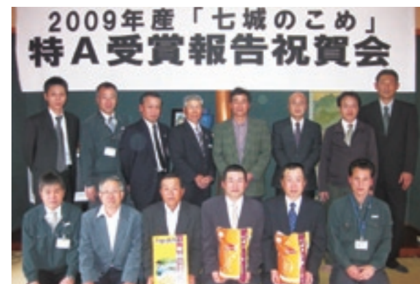
七城のこめ生産者の皆さん

日本穀物検定協会において、お米を味・香りなど6項目で評価した食味ランキングが発表され、熊本県城北地区代表で出品された2009年産「七城のこめ」が最高評価である特A(全国で20産地銘柄)を受賞し、その報告祝賀会が開催されました。七城のこめは平成20年度より環境に配慮した特別栽培米として生産され、2008年産米に続いての2年連続の受賞となり、生産者の「安全・安心でおいしい米づくり」の成果が実った形となりました。