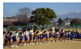
スタートの前に気合い十分