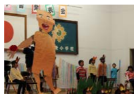
2年生「名前を見てちょうだい」