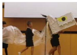
学習発表会に登場しました