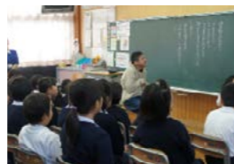
質問にも答えてくれました