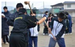
掛け声で息を合わせます