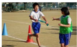
心を一つに襷をつなぎます

3学年各クラスから2チーム、合計22チームが出場。全力で襷をつなぐ白熱した戦いを繰り広げました。各学年の優勝クラスは下記のとおりです。