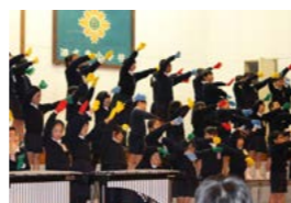
3年生「モチモチの木」

全校生徒による学習成果発表会を開催しました。各学年が授業や総合学習、修学旅行で学んだことを音楽劇や構成詩などで発表。練習の成果が現れた子どもたちの大きな声や工夫を凝らした演出に、来場した保護者や地域の皆さんから大きな拍手が送られました。