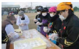
お手本を見ながら丸めます