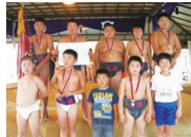
初優勝した七城小相撲クラブの子どもたち

また、昨年12月には、大相撲の熊本場所に、力士とのかけ稽古にも招待され、そこでも頑張って練習していました。