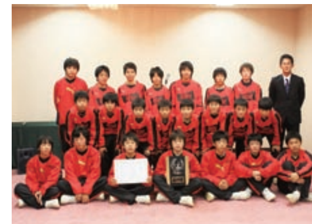
泗水中学校サッカー部のメンバー