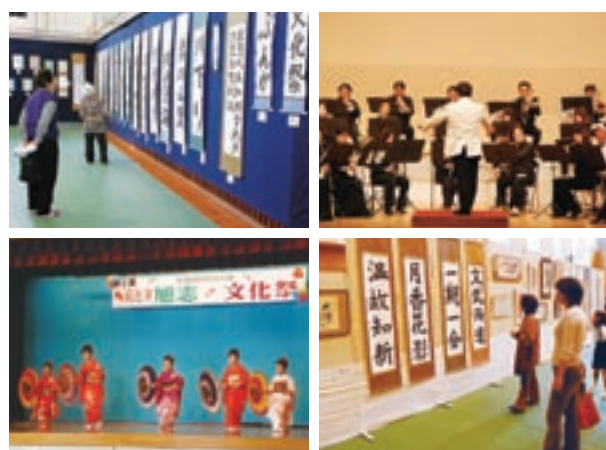
各支部のステージ発表と展示

4日間にわたり、各支部の会場では子どもから高齢者まで地域がひとつになって、地域の特色を活かした習字、絵画、写真、短歌、生花などの展示や茶道の御点前などが披露されました。また、舞台では吹奏楽・コーラス・箏などの演奏や日舞・フラダンス・バレエなどそれぞれ1年間の研鑽の成果を披露しました。