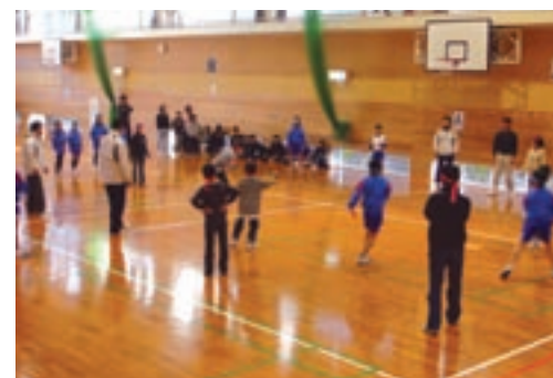
昨年の大会から(ドッチビー)

きれいな球体ではないふらばーボールを使ったバレーボールです。相手からきたボールをバウンドさせてから3回で返します。