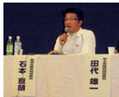
発表する石本体指

で受賞できました。ありがとうございました。「ごさいます」と感想を話されました。午後からは、3つの分科会に分かれて研修しました。第三分科会では菊池市の石本体指がパネラーを務め、テーマは「変わりゆく地域スポーツと新たな体育指導委員の役割」でした。パネルディスカッションの形で、石本体指は、菊池市の概要・体指の役割を発表しました。合併して組織が大きくなりましたが、今後、体指一人ひとりがそれぞれの役割を再認識し、今まで以上に協力し合い、