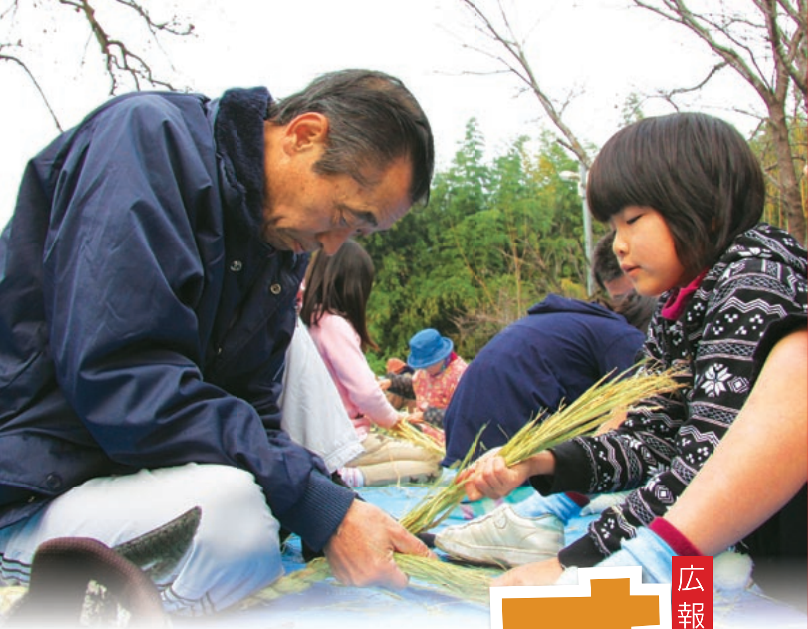
泗水久米一区で行われたしめ縄作りです。参加した子どもも大人も、真剣な表情で製作していました。