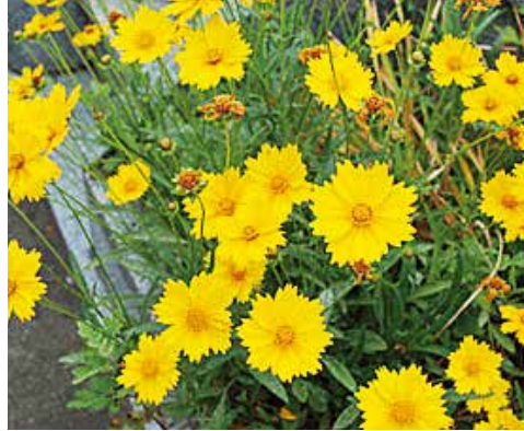
オオキンケイギク

市民の皆さんが自ら考え実践する地域づくりに対して経費の一部を補助し、市が進める豊かな水と緑、光あふれる田園文化のまちづくりの実現を図ります。 4つの対象事業 ① 地域づくり施設整備事業 掲示板などの設置、景観整備、公園の整備など。 ② 地域づくり活動事業 里山整備活動、防災訓練、交通安全教室、地域の祭りなど。 ③ 人材育成事業 地域づくり講習会への参加、地域づくり先進地研修など。 ④ 菊池遺産の保護および活用に関する事業 修復に伴う原材料費など。 補助の対象となる団体 ▼ 各行政区やこれに準ずる団体、またその集合体。 ▼ 地域づくりを目的として活動するNPO法人およびこれに準ずる10人以上の団体。ただし、規約などで地域づくりまたはそれに準ずる目的が明記されていること。 補助率・限度額 ① 対象となる経費の2分の1以内で40万円が上限 ② 対象となる経費の2分の1以内で20万円が上限 ③ 対象となる経費の2分の1以内で