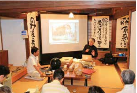
前回の菊池まちづくり道場