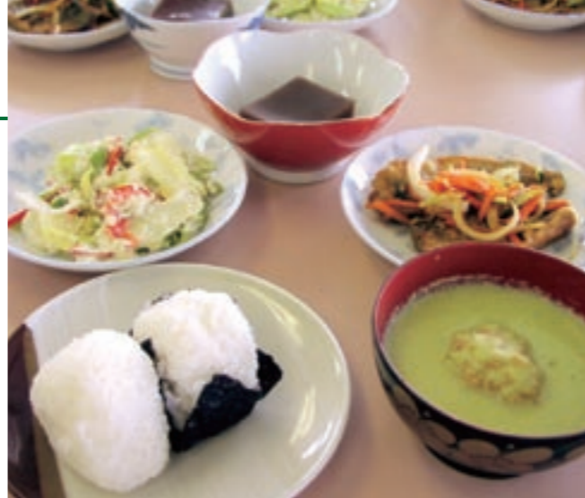
バランスのよい食事をするためには、さまざまな食品から、一日に必要な栄養素をむらなく取ることが大事です

事のバランス、軸は必要な水分、そして、コマを回転させるのは適度な運動です。コマは、食事バランスと適切な運動が与えられて、初めて安定して回転します。偏りのある食事をとった場合、コマのバランスが崩れてしまい、私たちの健康も保てなくなってしまうのです。