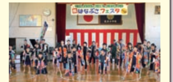
消防団(父親)・女性部(母親)と児童によるソーラン踊り