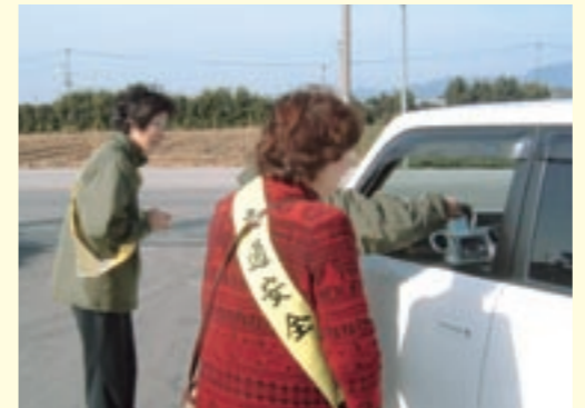
ドライバーに牛乳などを渡しなが、交通安全を呼びかける会員たち

この活動は、交通事故の多くなる年末前のこの時期に合わせて、毎年行われているもので、交通安全のたすきをつけた会員たちが、通りかかったドライバーに、同会が作成した交通事故防止運動のポスターと牛乳を渡しなが、交通安全を呼びかけました。