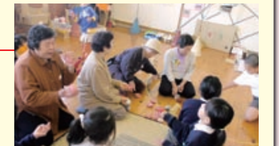
伝承遊びを楽しむゲストティーチャーと児童たち

また、参加者は、ヘルシーな昔ながらのふるさと料理「だご汁」とおにぎり、自家製たくあんの昼食に舌鼓をうちました。