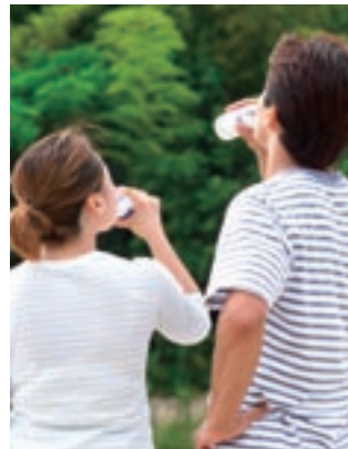
水分補給は、栄養バランスとともに食事の中で欠かせないものです

「コマ」の中では、1日分の料理・食品の例を示しています。これは、ほとんど1日座って仕事をしている運動習慣のない男性にとつての適量を示しています（およそ2,000kcal）。 まずは、自分の食事内容と「コマ」の料理を見比べてみてください。 ここで注意したいのは、あくまでコマの中には一例なので、実際に自分が取っている料理の数を数えるためには、「コマ」の横にある料理例を参考に、いくつ（SV：サービングの略）取っているかを数えることで、1日の目安量と比べることが出来ます。