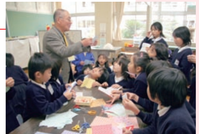
「ふれあいタイム」で、地域の人たちから折り紙の折り方(上)や竹馬の乗り方(右)を教わる児童たち