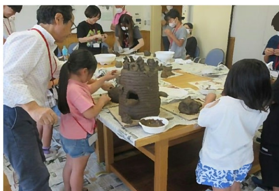
大地のメモリアの様子