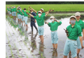
10月の稲刈りが楽しみ!

が、農業高校の実習の田植えは全く違いました。これからの実習も頑張ります。コメを作ってくださっている生産者への感謝の気持ちを忘れないようにしたいです」と話しました。