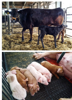
生後間もない動物たち

5月下旬から畜産科学科は出産ラッシュです。子犬、子豚、子牛とたくさん動物たちが生まれました。母乳を一生懸命探して飲むかわいらしい姿が見られます。