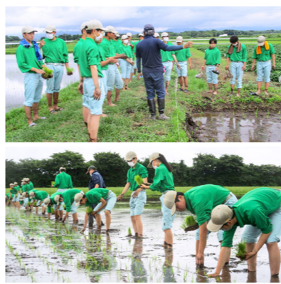
説明を聞いた後、植えていきます

本校では、農業への興味・関心を高め、命の尊さを学ぶために、1年生を対象に田植え実習を行っています。本年度は、感染症拡大防止の観点から一斉ではなくクラスごとに実施。泥まみれになりながらも一生懸命に田植えをし、とても楽しく実習を行うことができました。