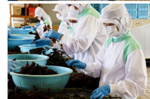
栽培から製造・販売まで学びます

ソの葉が必要で驚いたようです。今月、ジュースの販売が始まります。食品化学科の1年生が作ったシソジュースをぜひご賞味ください。