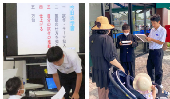
皆さんの協力の下、これまでに書道や音声訳、体操、戦争体験の講話、切り絵作品の鑑賞、花の苗植え、アンケートなどを行いました

本校は多くの地域の人に学校に足を運んでもらい、授業や委員会活動などで交流をしています。市内在住の専門家やボランティアの人から話を聞いたり、実践的な体験をしたりと、生徒にとって貴重な学びの場です。地域の皆さんの協力が、生徒たちの市民としての意識の高まりにつながっています。