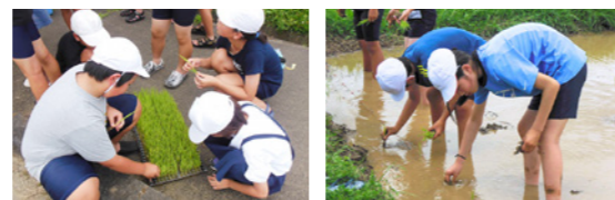
みんなで協力することや作物を育てることの大変さを学ぶことができました。秋には収穫の喜びをみんなで味わいたいです

5年生が地域栽培委員さんの指導の下、良質の種籾を選別する塩水選や種まき、苗作りを経て、大切に育ててきた苗を植えました。生徒は土の感触に戸惑いながらも、すぐにコツをつかみ、手際よく作業を進めていました。七城米は地域の誇り。おいしいコメに育つよう、収穫まで管理を続けていきます。