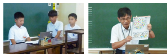
本校の教育目標は「自ら考え なかま高め合う 泗水小」です。校長先生の言葉を思い描き、実現に向けて取り組んでいます

夏休みが明け、登校してきた生徒の元気な声が校内に響き渡りました。前期後半スタート集会は、熱中症予防のためオンラインで開催。児童会の進行で進められ、学年代表の生徒たちによる決意が述べられました。校長からは「爽やかなあいさつが響く泗水小を目指しませんか」と提案がありました。