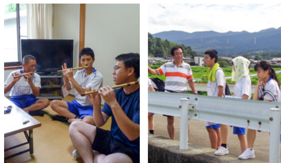
11月10日(金)に開催する学習発表会で、地域の人に学習の成果を披露する予定です。たくさんの方の参加をお待ちしています

3年生は総合的な学習の時間に「ふるさと再発見」に取り組んでいます。今年は湯舟神楽や円通寺太鼓、ほたる夜想曲を体験。また、ホタルマップの制作を地域の方の協力を得て進めています。生徒たちにとって、地域の人と触れ合うことは、ふるさと旭志を改めて深く知る大切な時間となっています。