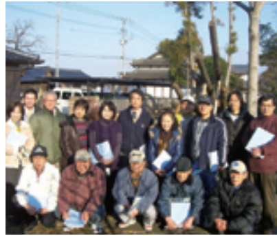
菊池遺産認定審査委員

これまでの、学術的価値を重んじる指定文化財制度とは異なり、市民自らが選び、市民の人たちで構成された審査委員会で審査し、市長が「菊池遺産」として認定します。