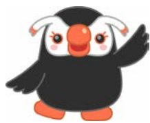
北方領土イメージキャラクター エリカちゃん