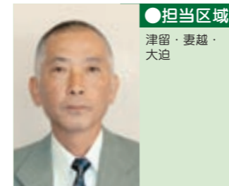
22 高宗 和敏