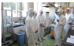
仕事の説明を受ける生徒