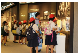
資料館を見学する児童たち