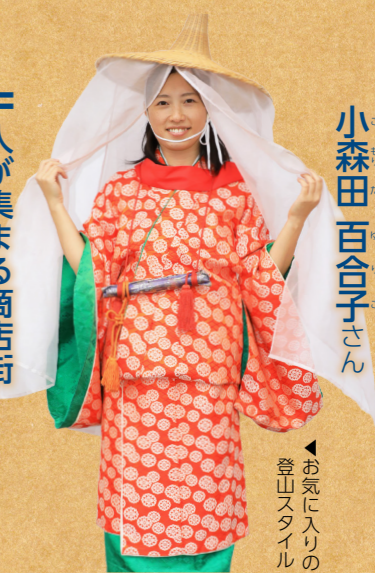
お気に入りの登山スタイル