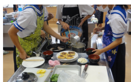
楽しく調理しました