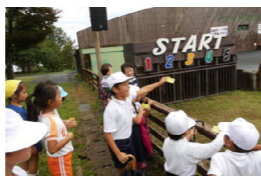
動物ふれあい体験