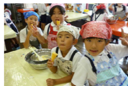
アイスクリーム作り体験

1年生と2年生を対象に秋の移動教室を実施しました。1年生は大牟田市動物園を訪問。2年生は阿蘇ミルク牧場を訪れ、動物レースやアイス作り体験などを楽しみました。参加した児童は「みんなで作ったアイスクリームは、甘くてとってもおいしかったです」と笑顔を見せました。