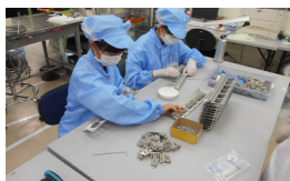
部品を1つずつ点検