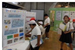
パネル展示を見学

5年生が水俣市にある水俣病資料館を訪れ、水俣病や環境問題について学びました。この学習は「水俣に学ぶ肥後っ子教室」と呼ばれており、毎年県内全ての小学5年生を対象に行われています。参加した児童たちは、語り部の話を聞いたり、資料館内を見学したりして水俣病の正しい知識を学んでいました。